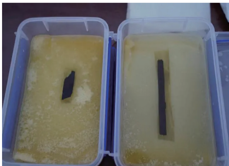
正在保护修复中的秦简牍