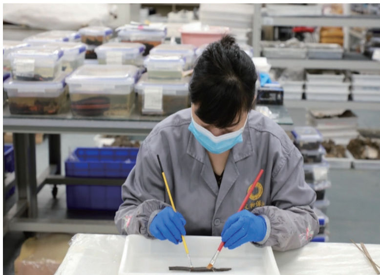
文保人员清理秦简