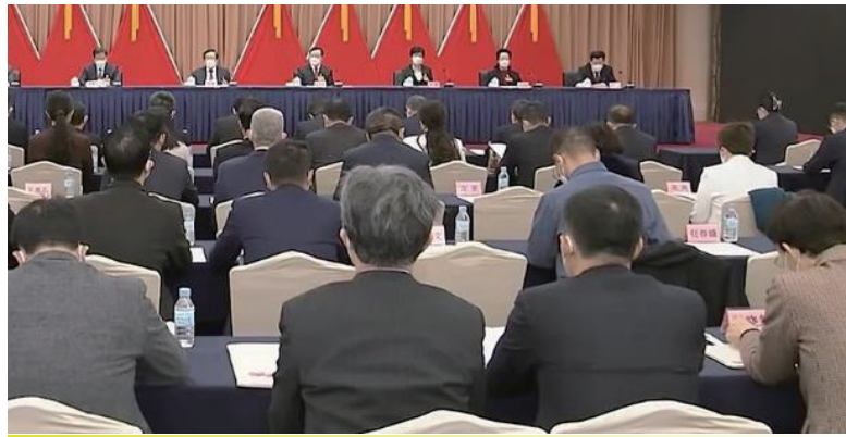
中国致公党第十六次全国代表大会