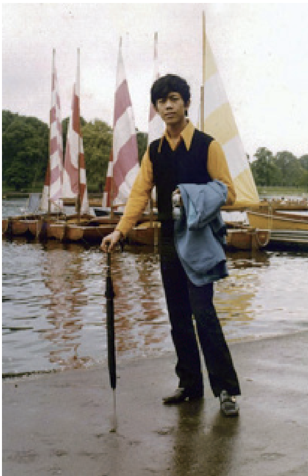
伦敦海德公园留影