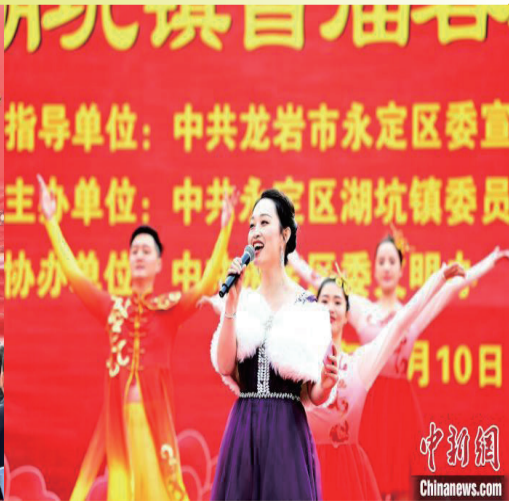
歌伴舞《美丽湖坑》