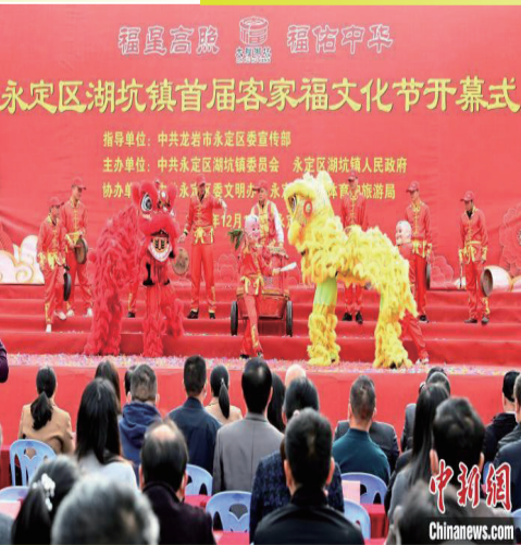
狮鼓上演《迎福》