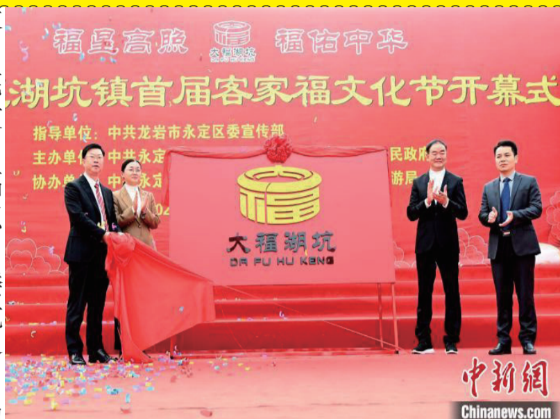
“大福湖坑”形象标识在首届客家福文化节开幕式上正式亮相。