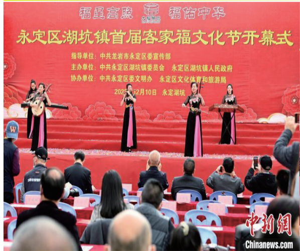
民乐合奏。