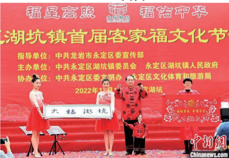
非遗送“福”表演《木偶书画和客家剪纸》。