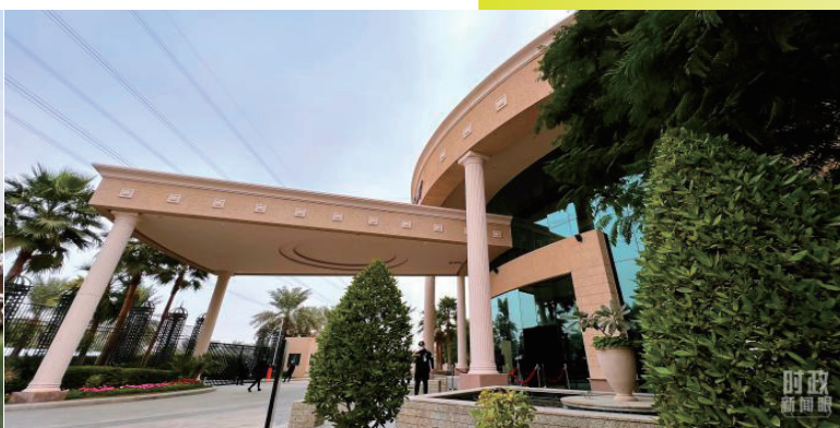
习近平在这里密集会见12国领导人。