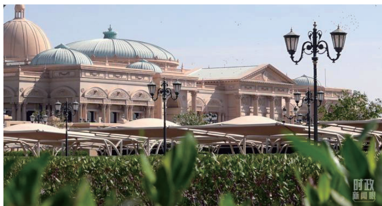
中海峰会会场外。