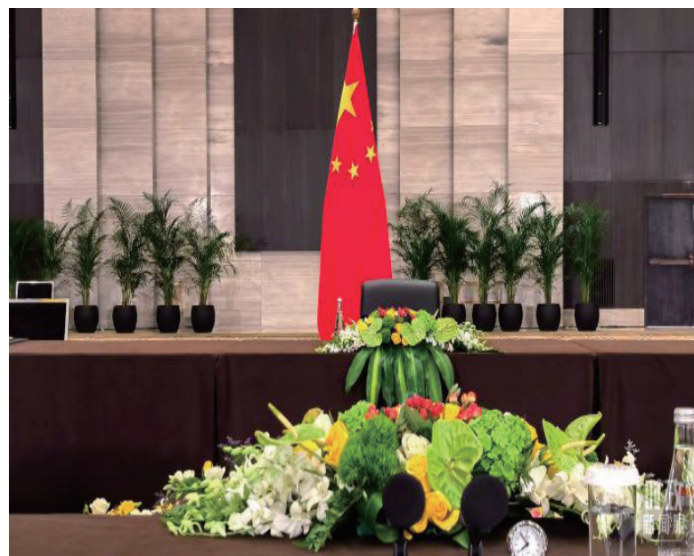
会见现场的中国国旗。