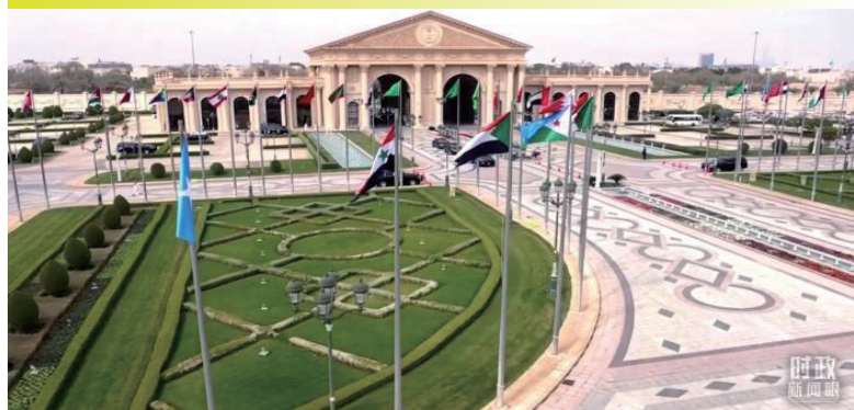
阿卜杜勒阿齐兹国王国际会议中心，中海峰会在这里举行。