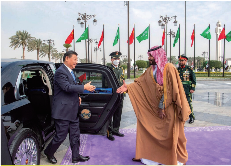
周四在沙特首都利雅德，穆罕默德·本·萨勒曼王储（右）迎接中国领导人习近平。

方“2030愿景”、“绿色中东”等一系列重大发展倡议，愿积极参与沙特工业化进程，助力沙特经济多元化发展……沙方愿同中方继续积极共建“一带一路”，扩大贸易与相互投资，欢迎更多中国企业积极参与沙特工业化进程，参加沙特重大基础设施建设和能源项目合作，加强在汽车、科技、化工、矿业等领域合作。