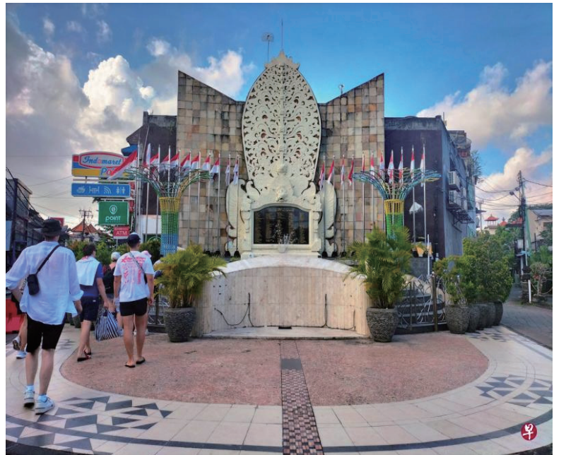
印尼当局12月7日正式假释巴厘岛爆炸案主犯乌玛尔，引发澳大利亚不满。图为游客参观巴厘岛爆炸案纪念碑。