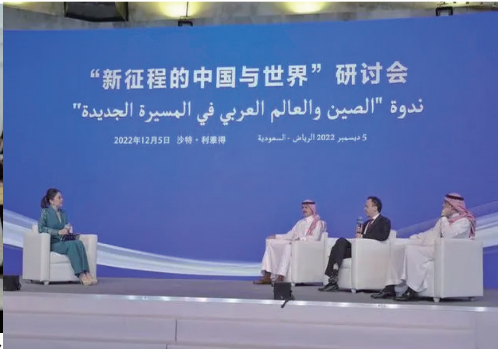
12月5日，“新征程的中国与世界”中阿媒体研讨会现场