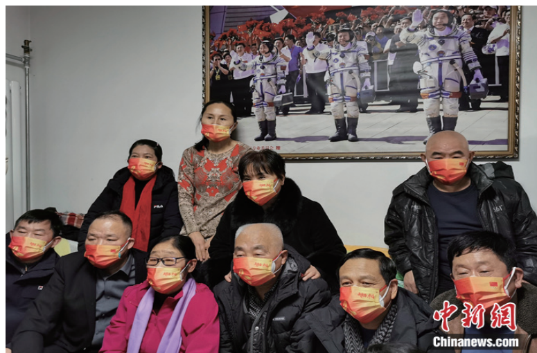
航天员刘洋父母家中，亲友们相聚在一起观看直播迎接航天员凯旋。