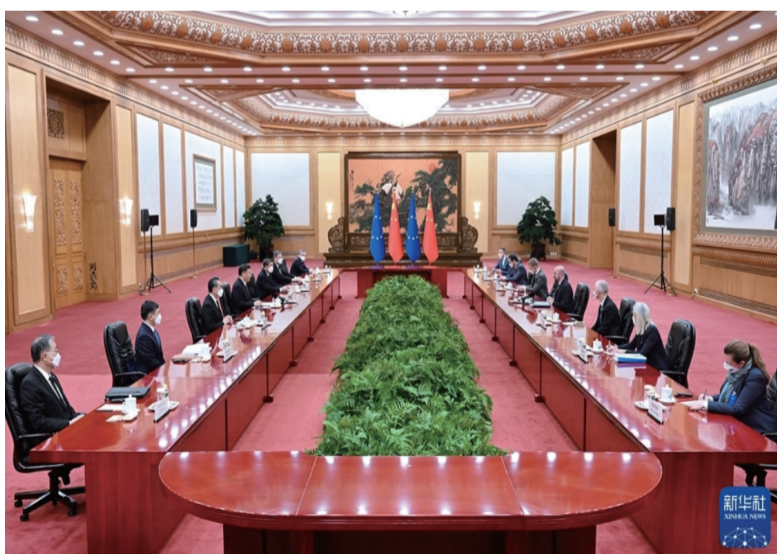
12月1日，国家主席习近平在北京人民大会堂同欧洲理事会主席米歇尔举行会谈。