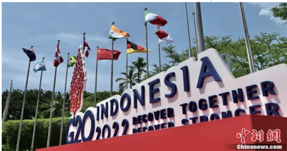
11月15日，二十国集团(G20)领导人第十七次峰会在印尼巴厘岛开幕。

用，展示了不同于大国的地区秩序治理能力。这是“二代东盟”的特质。二代东盟的提法来自海外著名华人历史学家王赓武先生。他在2021年10月的一次题为《新丝绸之路：中国与东盟》的线上英文讲座中说，第一代东盟是在东南亚地区主要国家转向资本主义，与西方大国重新结盟的过程中出现的。随着中、美之间力量平衡的改变，更加独立的第二代东盟得以出现。笔者深为认同王赓武先生有关二代东