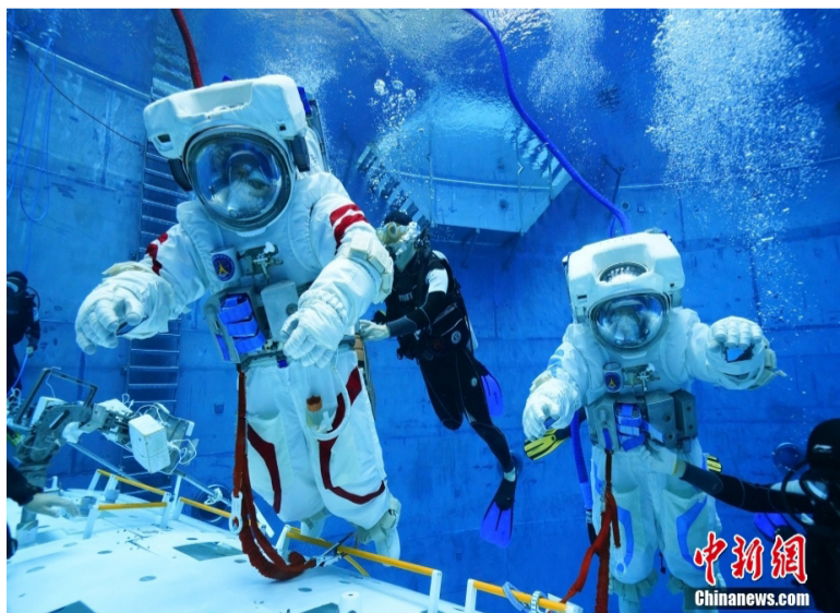
图为2022年9月16日，神舟十五号航天员乘组水下训练。