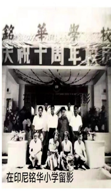
在印尼铭华小学留影