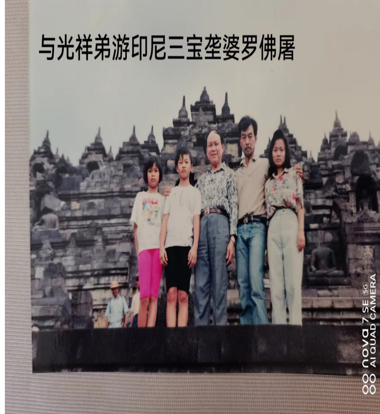
与光祥弟游印尼三宝壟婆罗佛屠