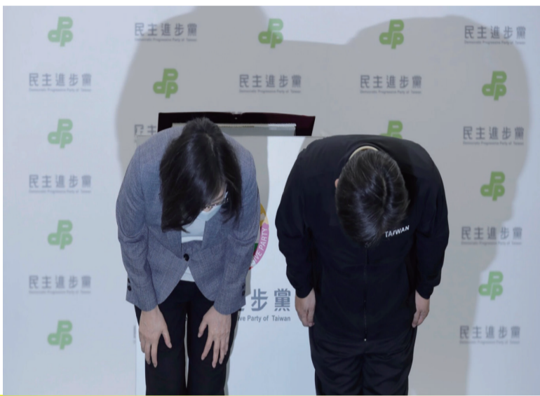
为2022年11月26日的九合一败选负责，身兼民进党主席的台湾总统蔡英文（左）宣布辞去党主席一职。

主打防疫政绩、反黑金和抗中牌全失灵，台湾执政的民进党在“九合一”地方选举遭遇历来最大挫败，执政县市跌剩五个，在北台湾全面溃败，给来届总统选举敲响警钟。台湾总统蔡英文宣布辞去党主席，台湾政坛进入“后小英”时代。