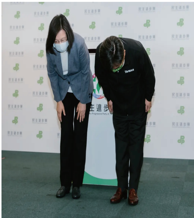
蔡英文于26日晚间宣布辞去党主席一职，以示对该党在台湾地区“九合一”选举中的表现负责