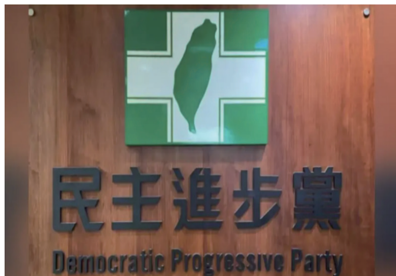
眼下，绿营已经开始清算民进党内部“战犯”。图自《联合报》