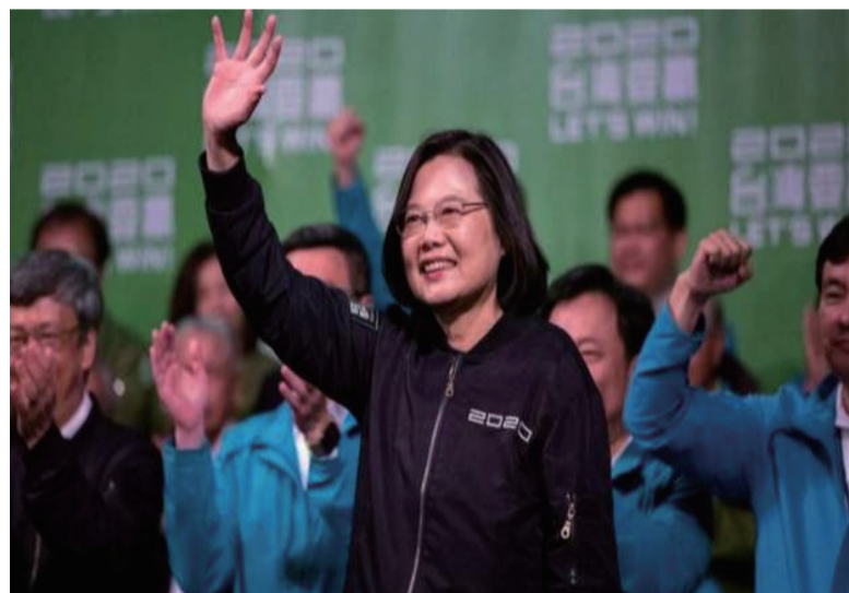
蔡英文已宣布辞去民进党党主席。