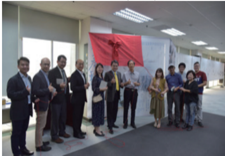
“屏东文学展”开展揭幕仪式

文学与文化”（2016）、“历史·诗歌·跨界”（2018）、“文学与文化”（2020）等，在呈现屏东文学研究的多元性。在跨入在地全球化的新视野”（2020）等，在呈现屏东文学研究的多元性。在跨入第十一年的2022年屏