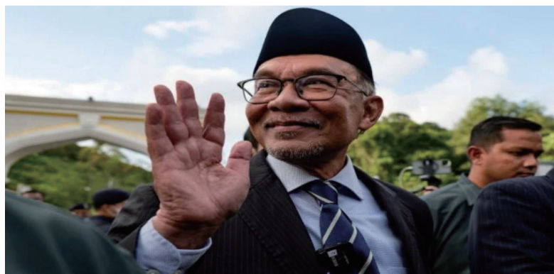
马来西亚安瓦尔为新任总理