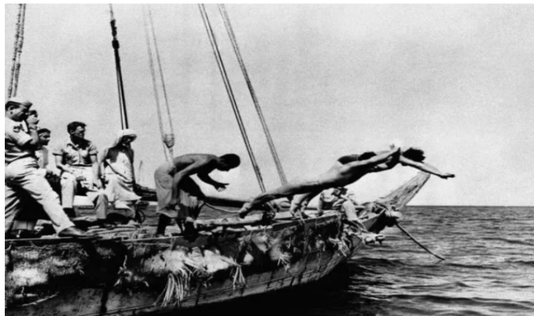
图注：采集珍珠的卡塔尔人