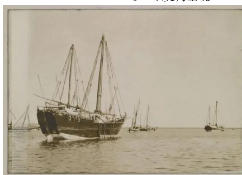
图注：卡塔尔人采集珍珠的船只