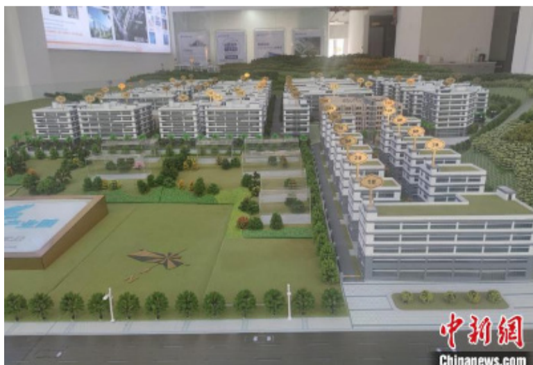
规划中的美岭智慧园区招商中心。