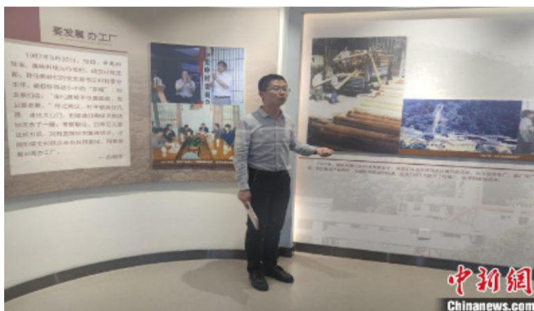
美岭中学教师介绍美岭村创业史。