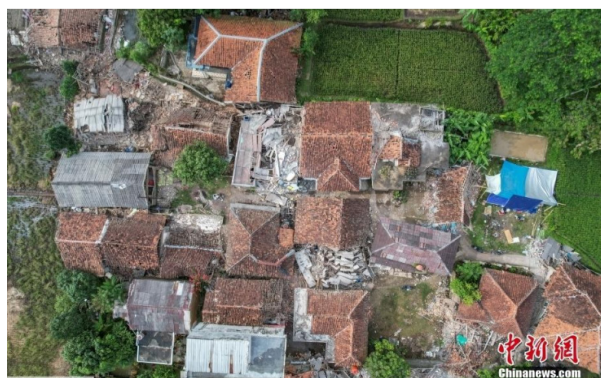
图为震中地区许多房屋、树木倒塌。据美联社介绍，这一地区大约有175000居民，超过13000人的房屋在强震中遭到破坏，被迫离家避难。