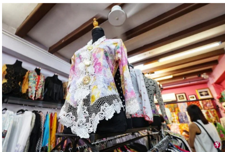
卡峇雅在20世纪之交成为流行服饰，在本地，马来族和娘惹妇女较常穿卡峇雅。图为甘榜格南精品店的卡峇雅。