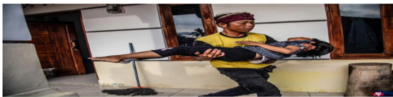
印尼西爪哇省地震罹难者中，很多都是儿童，图为展玉镇一个村民抱着受伤的女儿去求医。

（展玉镇综合电）印度尼西亚西爪哇省星期一（11月21日）发生5.6级地震后，罹难者激增到272人死，加13784居民成难民，因2354房子和建筑物倒塌。死者多为儿童，另有100多人失踪。印尼总统佐科下令搜救工作优先解救受困的生还者。