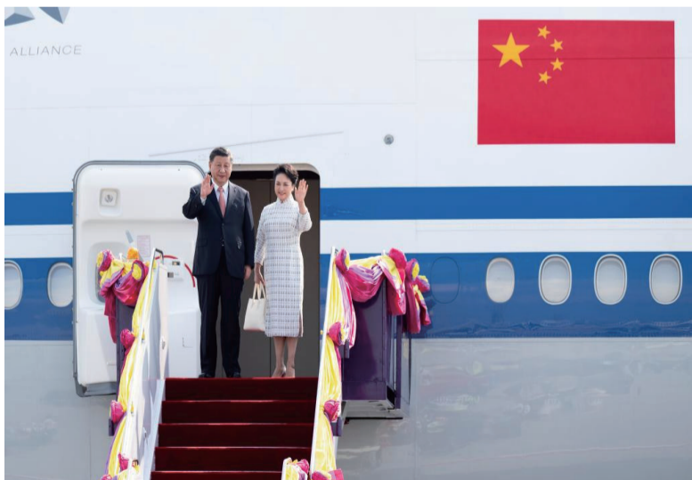
当地时间11月17日下午，国家主席习近平乘专机抵达泰国曼谷，出席亚太经合组织第二十九次领导人非正式会议并对泰国进行访问。这是习近平和夫人彭丽媛步出专机舱门。