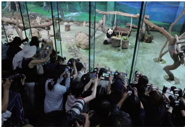
2020年7月6日，参观者在台北市立动物园拍摄大熊猫“圆仔”。当日，台北市立动物园为大陆赠台大熊猫“团团”“圆圆”的孩子“圆仔”庆祝7周岁生日。