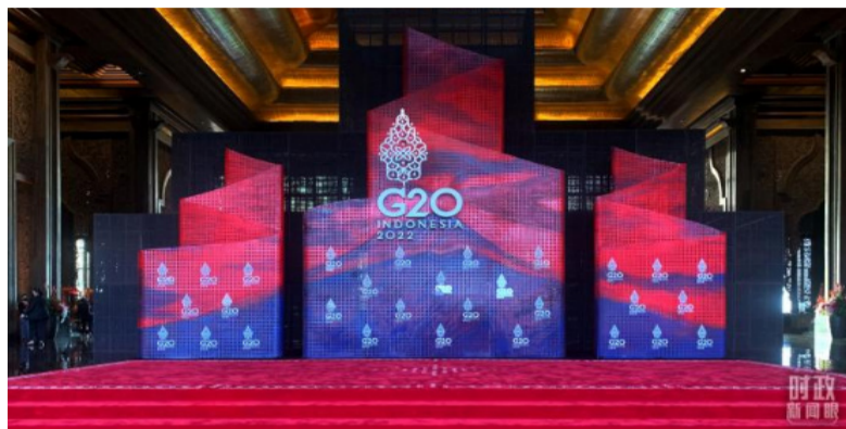
11月15日上午，巴厘岛峰会的迎接仪式在这里举行。