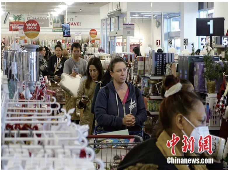
美国纽约一家商店内的顾客排队结账。

编者按： 现代化，一场跨越数百年、关涉五大洲的全球社会大转型，贯穿经济、科技、政治、文化等领域，给世界带来巨变。中国，无疑也是这历史进程中的一部分。