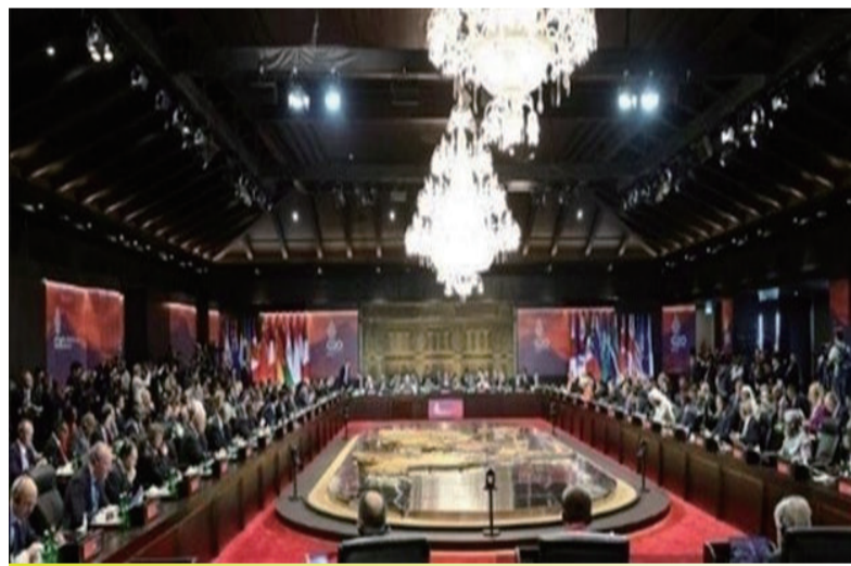
当地时间15日上午，二十国集团领导人第十七次峰会在印度尼西亚巴厘岛开幕。

币基金组织要加快落实向低收入国家转借特别提款权进程。国际金融机构和商业债权人作为发展中国家的主要债权方，应该参与对发展中国家减缓债行动。中方全面落实二十国集团缓债倡议，缓债总额在二十国集团成员中最大，并同有关成员一道参与《二十国集团缓债倡议后续债务处