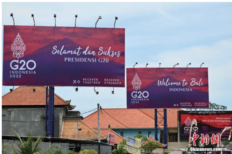
11月13日，印尼巴厘岛的街道挂有巨型欢迎海报，气氛浓厚。二十国集团(G20)领导人第十七次峰会将于11月15日至16日在印尼巴厘岛举行。