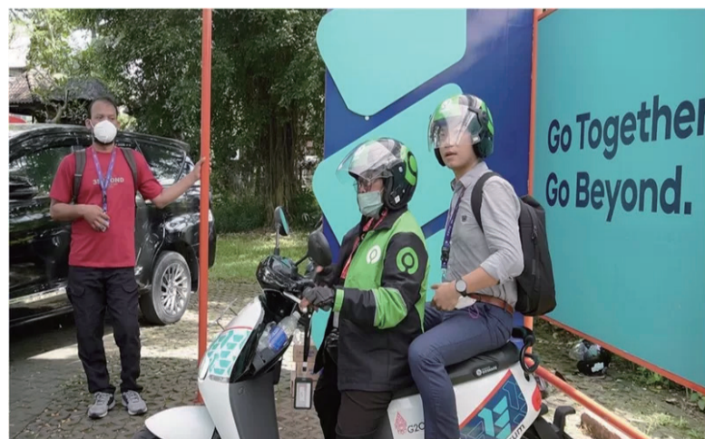
G20峰会会场为采访的媒体记者提供了电动摩托车服务。图为BBC中文记者乘坐峰会提供的电动摩托外出采访。