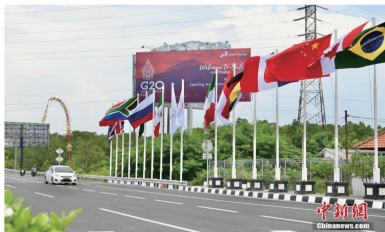
11月13日，印尼巴厘岛道路上G20成员国的国旗及欢迎海报。二十国集团(G20)领导人第十七次峰会将于11月15日至16日在印尼巴厘岛举行。