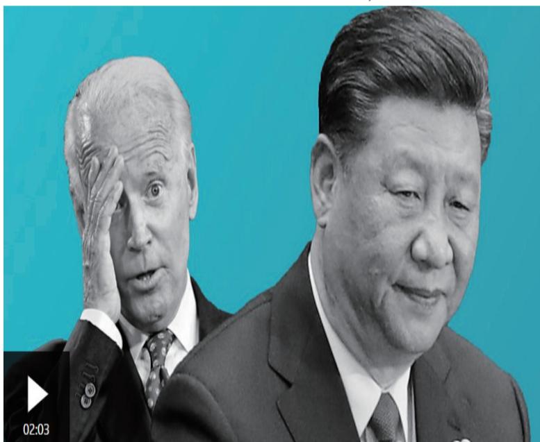
G20峰会：拜登与习近平会谈，将讨论台湾等议题并划出“红线”

会和中国国际进口博览会。以此次G20巴厘岛峰会为契机，印尼将深化与中国等友好国家合作，推动G20成员团结一致，坚持包容性和平等，解决共同问题，创造一个没有人掉队的更美好世界。(海外网陆宁远)