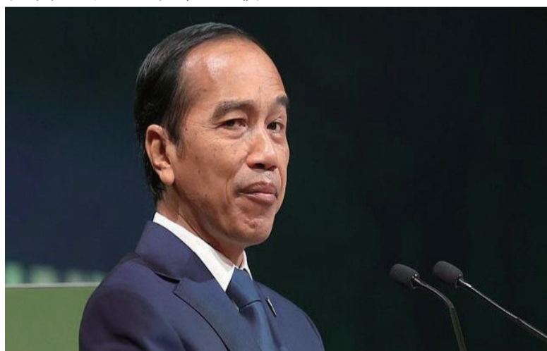
印度尼西亚总统佐科 视觉中国 资料图