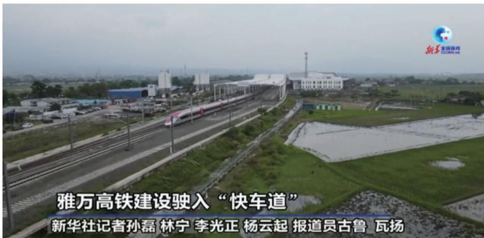
雅万高铁建设驶入“快车道”