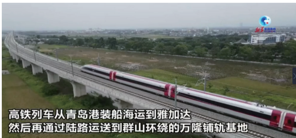
高铁列车从青岛港装船海运到雅加达 然后再通过陆路运送到群山环绕的万隆铺轨基地

11月15日至16日，二十国集团(G20)领导人第十七次峰会在印度尼西亚巴厘岛举行。中印尼两国务实合作的标志性项目雅万高铁近日成功进行了试验段接触网热滑试验，并将于峰会期间展示建设成果。