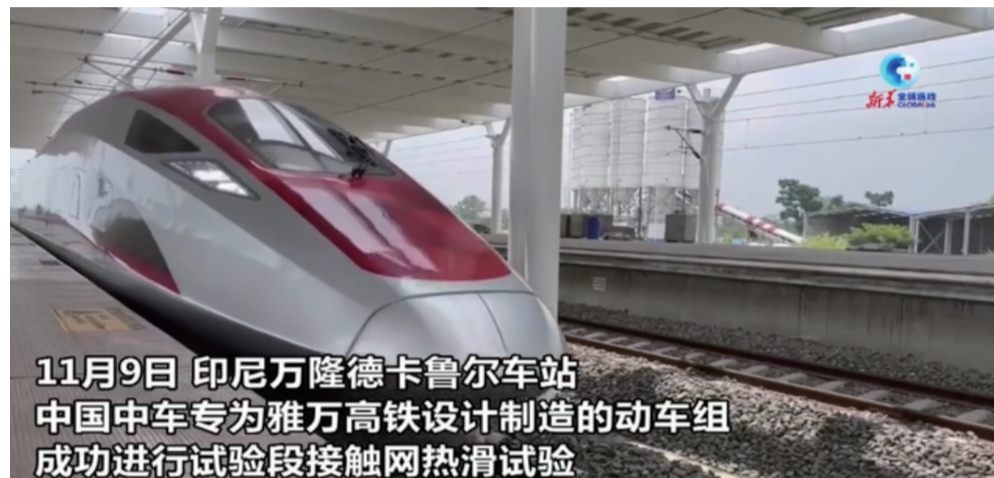
11月9日 印尼万隆德卡鲁尔车站 中国中车专为雅万高铁设计制造的动车组 成功进行试验段接触网热滑试验