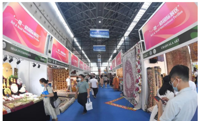
参观者在东博会“一带一路”国际展区参观。