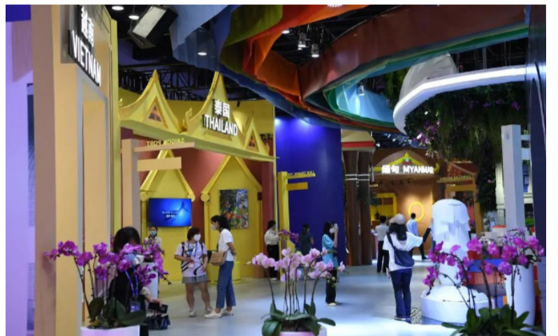
参观者在东博会“魅力之城”展区参观。