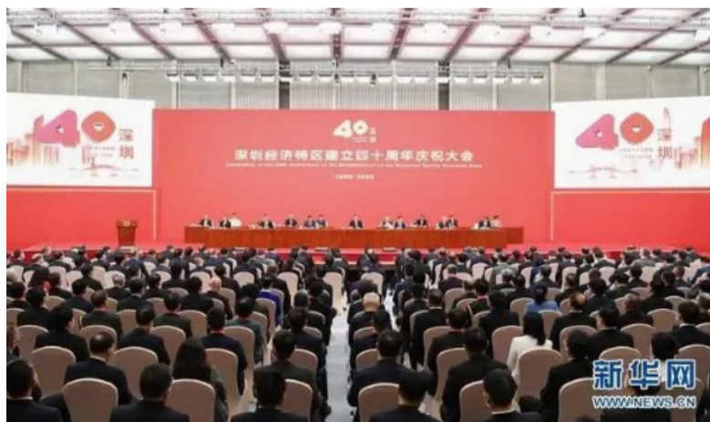
2020年10月14日，深圳经济特区建立40周年庆祝大会在广东省深圳市隆重举行。习近平在会上发表重要讲话。