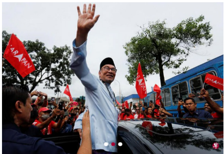
希盟及公正党主席安华是第一个提交提名表格的霹雳州打扞国会选区候选人。他昨天早上9时提交表格，并在之后的候选人抽签中抽到1号。图为提名结束后，安华向支持者挥手致谢。