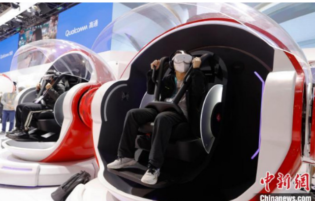
技术装备展区内，参观者在高通展台体验骁龙XR奇幻之旅。