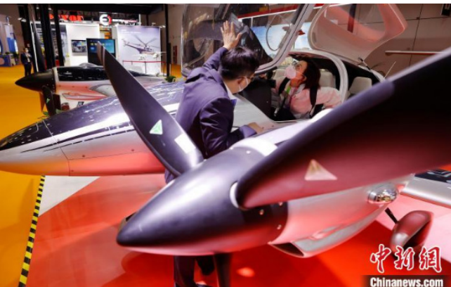
技术装备展区内，参观者在万丰钻石飞机展台了解DA40-EP混合动力4座飞机。殷立勤 摄