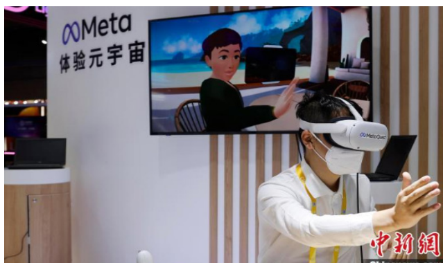
技术装备展区内，参观者在“Meta”展台体验元宇宙。