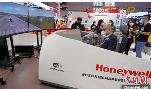
技术装备展区内，参观者在霍尼韦尔展台体验模拟飞行。