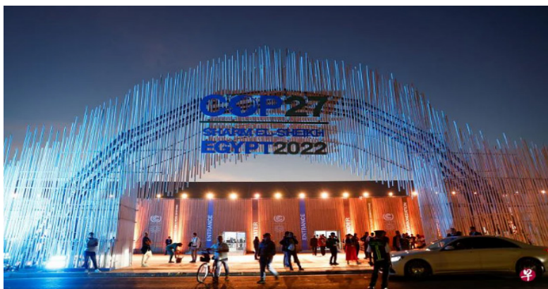
联合国气候变化大会第27次缔约方会议6日在埃及红海度假胜地沙姆沙伊赫市开幕。图为国际会议中心的正门。

（早报讯）联合国气候变化大会第27次缔约方会议（COP27）星期天（11月6日）正式在埃及沙姆沙伊赫市开幕，有关富国对穷国作出气候赔偿的问题成为焦点。