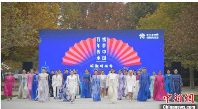
11月6日,以戏曲等传统文化元素跨界运用为主题的服饰演绎在北京园博园上演。