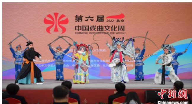
11月6日,第六届中国戏曲文化周在北京园博园阳光剧场举办开幕式。

第六届中国戏曲文化周已于11月4日启动,主场活动将于11月10日闭幕,后续还将在北京园博园持续开展常态戏曲演出,并深入社区村开展“戏炫生活共享小康”主题活动、“小戏台”、“嬉戏”亲子剧场等活动,做到“主场结束不散场,常态活动贯全年”。(完)