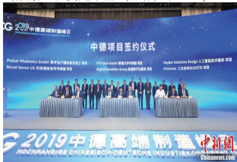
2019年11月30日，2019中德高端制造峰会在浙江绍兴举行，来自中德两国政府代表、制造业专家学者及企业家代表等500余人参会。

德国是世界上最先进的工业大国之一，经济以出口为导向，而中国作为后起工业化的发展中国家急需先进技术和管理经验，因此双边经济互补性很强。中国向德国出口劳动密集型工业制成品，从德国进口先进工业设备成为双方合作的基础。上世纪90年代，中德货物贸易年均增长16.1%；2000年至2010年，年均增长为22.7%；2011年至2021年，随着中国经济增长进入“新常态”，双边贸易增长有所放缓，但是仍然增长了70%，2021