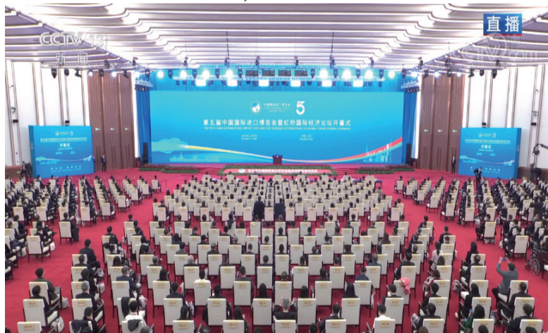
第五届中国国际进口博览会开幕典礼