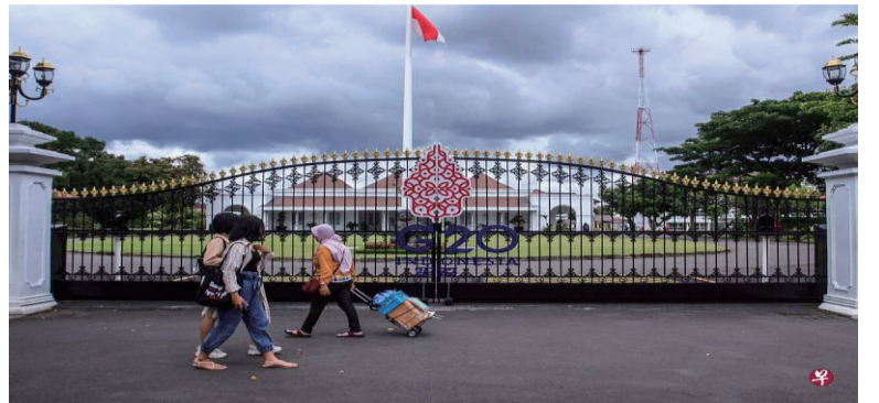
印尼努力促成全员参与在巴厘岛举行的二十国集团峰会。10月30日的照片显示，日惹宫已为峰会做好布置。

面對地緣政治緊張局勢以及烏克蘭戰爭，首次擔任輪值主席國的印尼正在努力促成全員參與，以提高其國際地位。佐科星期三說，他將致電三位國家元首，以確認他們的決定。