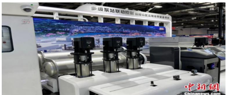
一系列治水新产品、新技术、新工法、新案例在2022中国水博览会上展示。