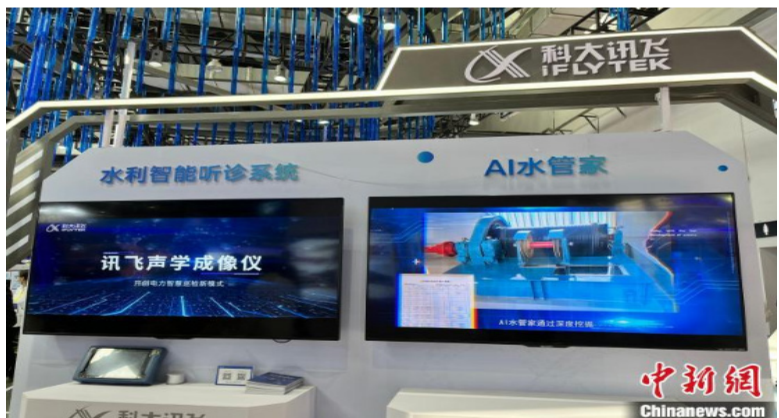
一系列治水新产品、新技术、新工法、新案例在2022中国水博览会上展示。