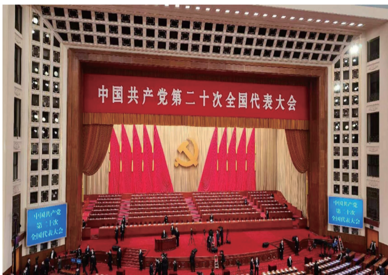
中国共产党二十大

中新社北京10月31日电(记者邢翀李京泽)中共二十大闭幕后,多位外方领导人接连来华访问。10月30日至11月2日,越共中央总书记阮富仲对中国进行正式访问,成为中共二十大后首位访华的外方领导人。