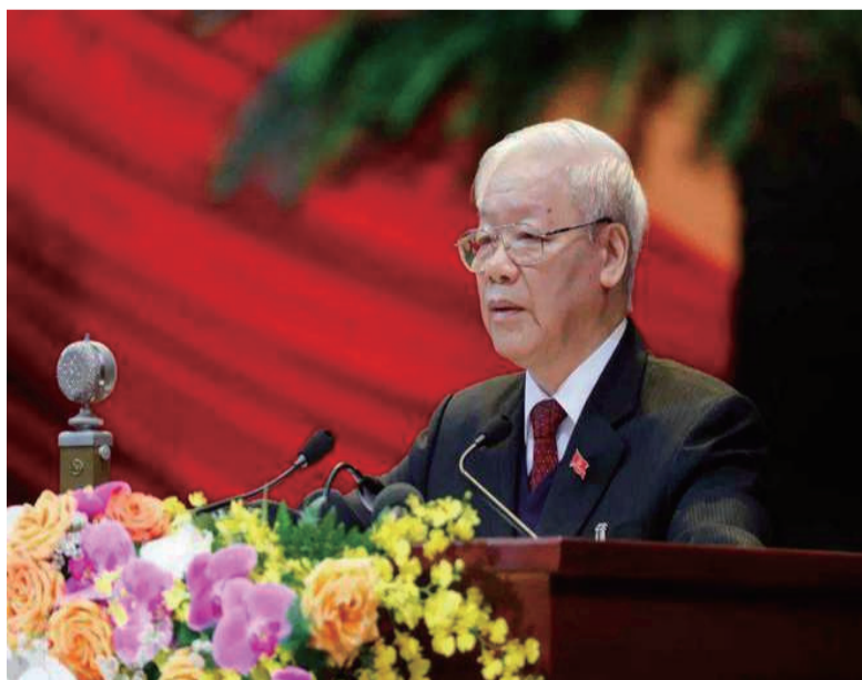
越共中央总书记阮富仲

眼下全球安全发展面临严峻挑战,非洲国家也在寻求维护自身安全和实现发展的出路。观察家认为,中国提出的全球发展倡议和全球安全倡议符合非洲国家利