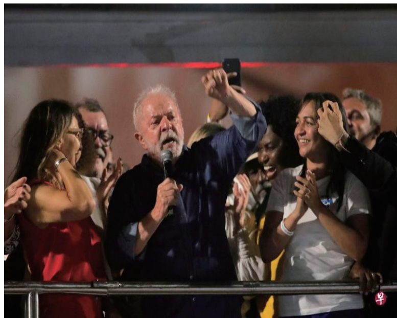
卢拉（中）在胜选后说，新政府的首要任务是解决巴西民众的饥饿问题，为国内贫困人口提供更多财政支持。