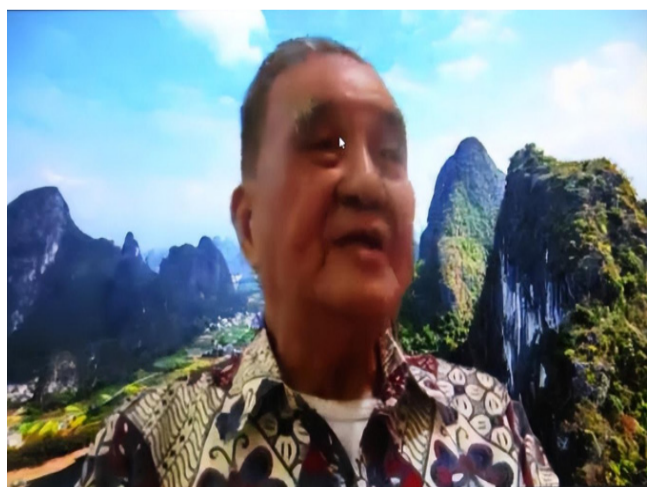
【李卓辉总编辑线上分享】