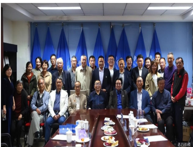
【部分参会代表合影】