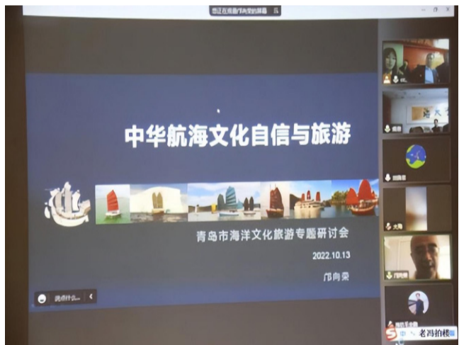
【邝向荣设计师线上分享】