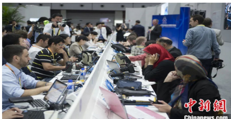
2014年，亚信会第四次峰会在上海举行，各国记者在新闻中心忙碌。

中新社记者：亚信会议目前有27个成员国，在政治制度、历史文化、宗教传统等方面存在明显的多样性。因此，在相互协作与信任中，不同文明的对话与交流必不可少，您如何看待信任建设中文明互鉴的作用？