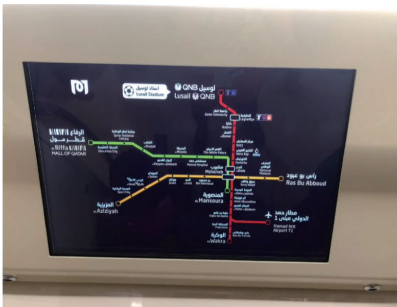
卡塔尔当地的地铁大大缓解了交通拥堵状况