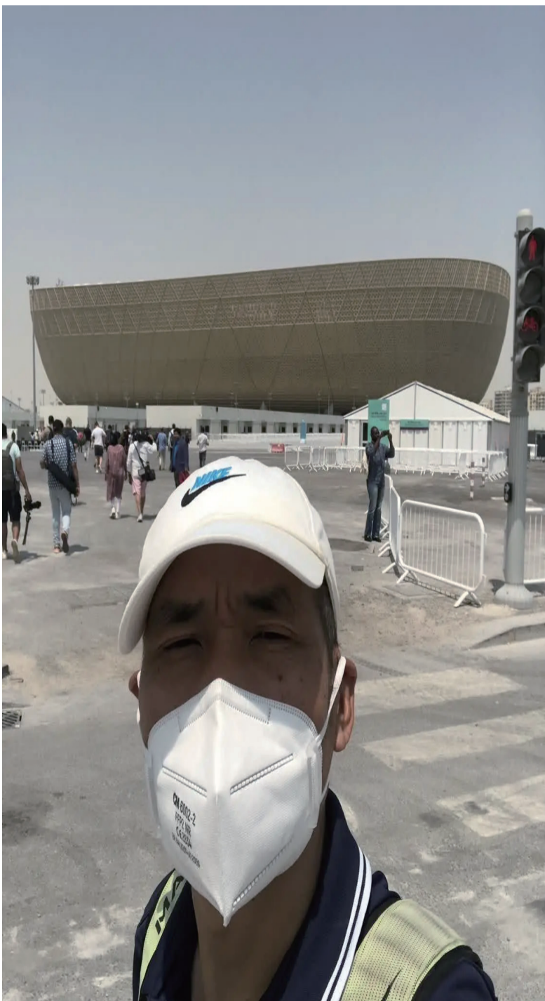
中国记者戴着口罩在卡塔尔采访