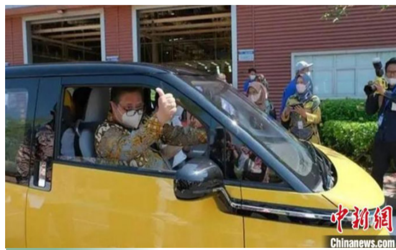
图为东南亚消费者试驾体验广西新能源汽车性能