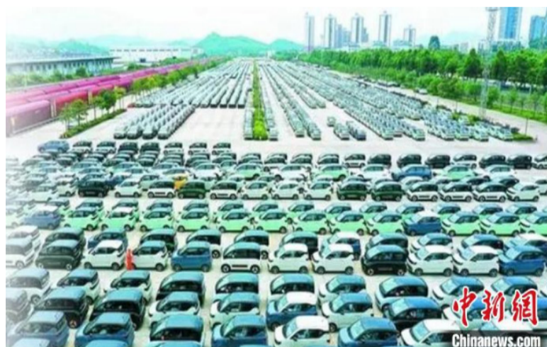
图为即将出口的广西新能源汽车

限公司在印尼国际车展，首次发布新能源全球车Air ev(右舵版)；9月初，该公司为日本ASF株式会社生产的纯电动物流车样车下线交付，成为首次进军日本市场的广西新能源汽车车型。(完)