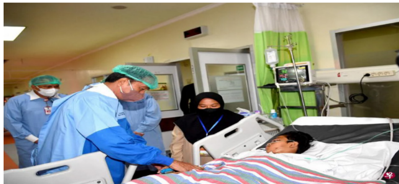
印尼总统佐科星期三到马琅县的医院看望踩踏意外的伤者，并到事故发生的体育场视察。

(雅加达综合电) 印度尼西亚总统佐科下令审查全国所有体育场的设施安全，并透露国际足球总会愿意帮助印尼整顿足球运动的管理。