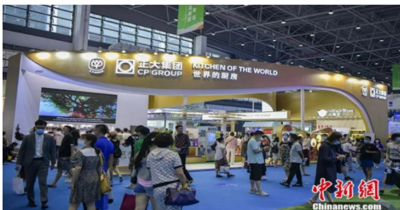
泰国大型华商企业正大集团参加2021年在海南省海口市举办的首届中国国际消费品博览会。

在泰国，华商企业竞领风骚，大批华商翘楚成就非凡，然成为一种现象。国民家族、苏旭明家族等常年位居当地富豪榜前列。那么，是什么构成了泰国华商企业的文化底色和管理特色？