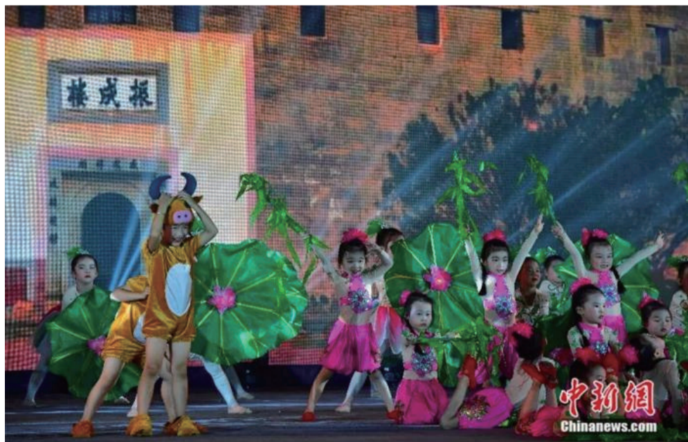
孩子们表演舞蹈《客家童谣》。

客家人在海外的主要聚居地是东南亚的印尼、马来西亚、新加坡、缅甸等国家。新的统计显示，英国、荷兰、澳大利亚、加拿大、巴拿马、美国、古巴、圭亚那、苏里南、巴西、巴布亚新几内亚、毛里求斯、秘鲁、非洲（主要在南非）等地都有客家村落，也都有为数不少