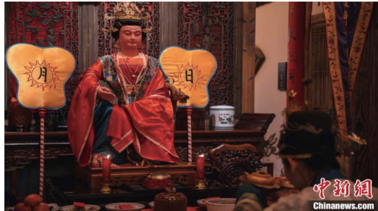
执事人员向妈祖献上“茶帮”的“香茶”。