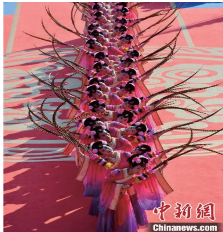
图为海祭妈祖大典现场。