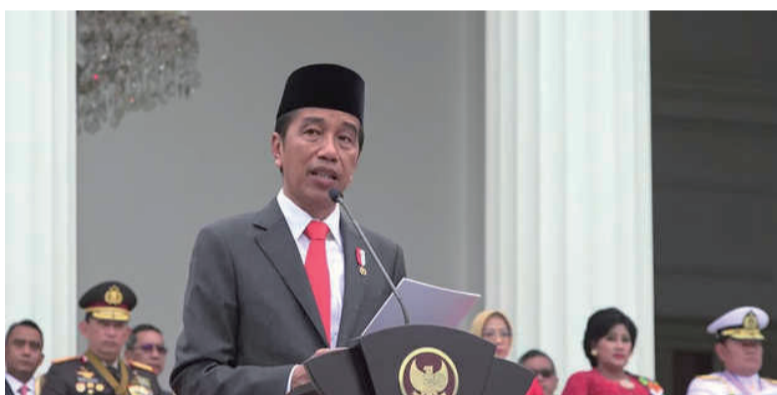
2022年10月5日，星期三，在雅加达中部独立宫举行的国军TNI成立77周年庆典演讲中，总统佐科维发表讲话。